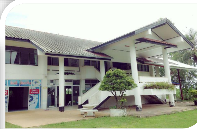
โรงพยาบาลส่งเสริมสุขภาพตำบล 6 แห่ง