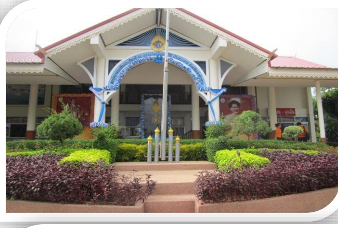
โรงพยาบาลชุมชน ขนาด F3 บุคลากร 80 คน