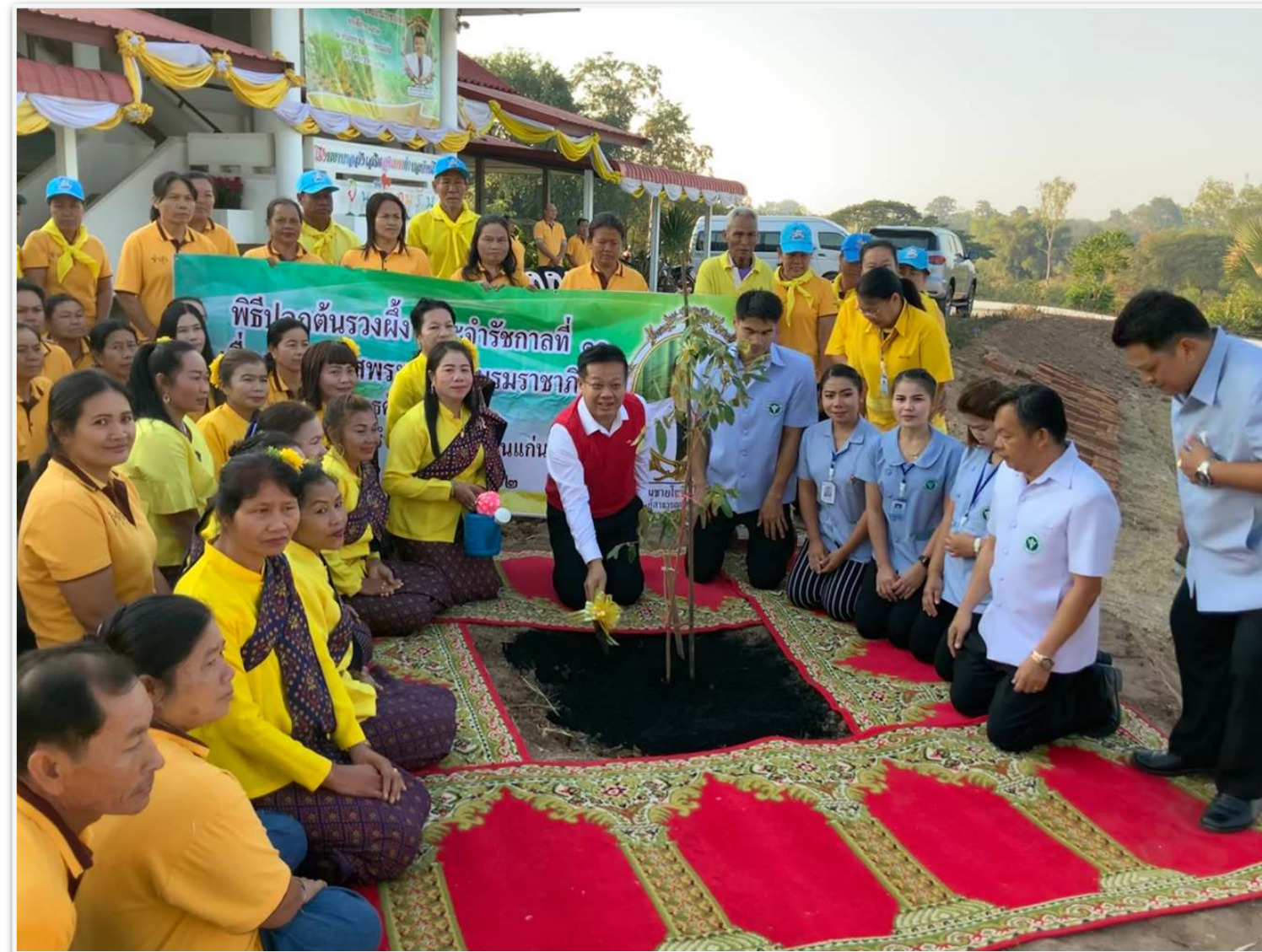
ต้นรวงผึ้ง