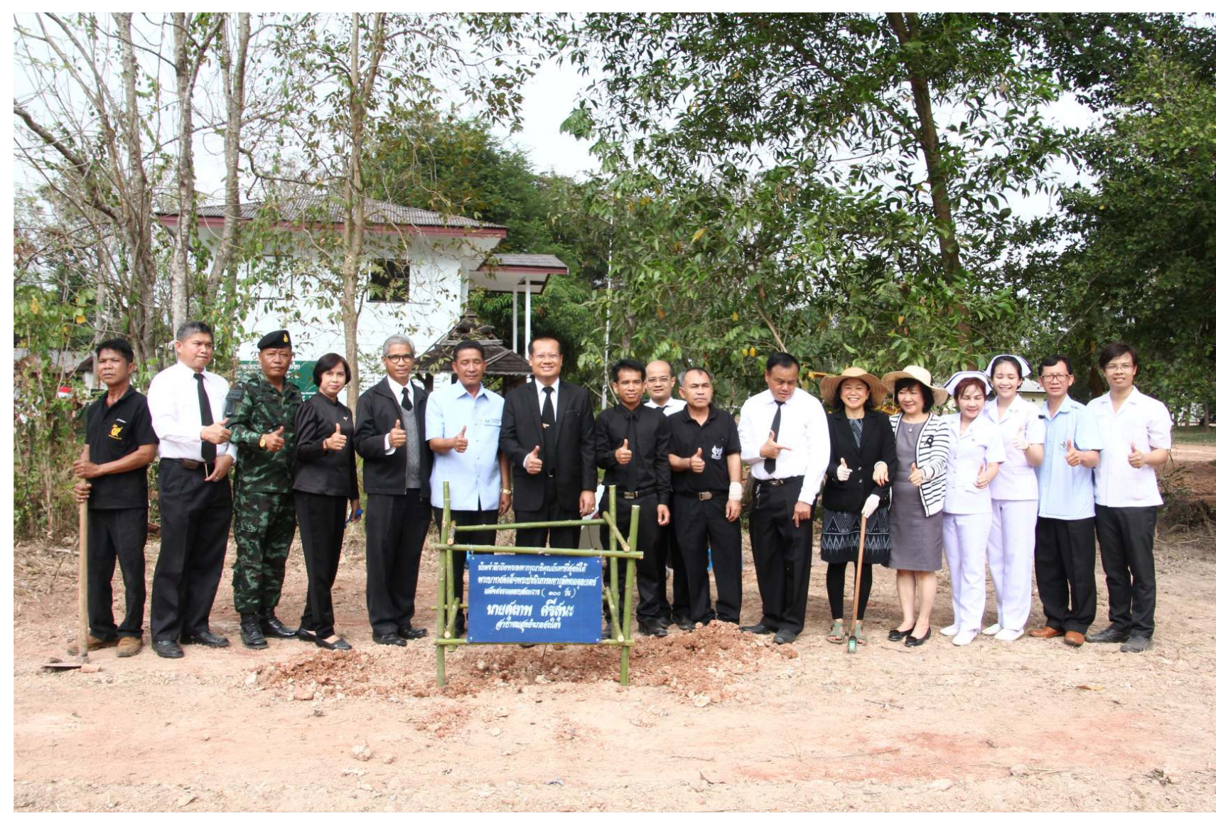
ต้นกันเกรา