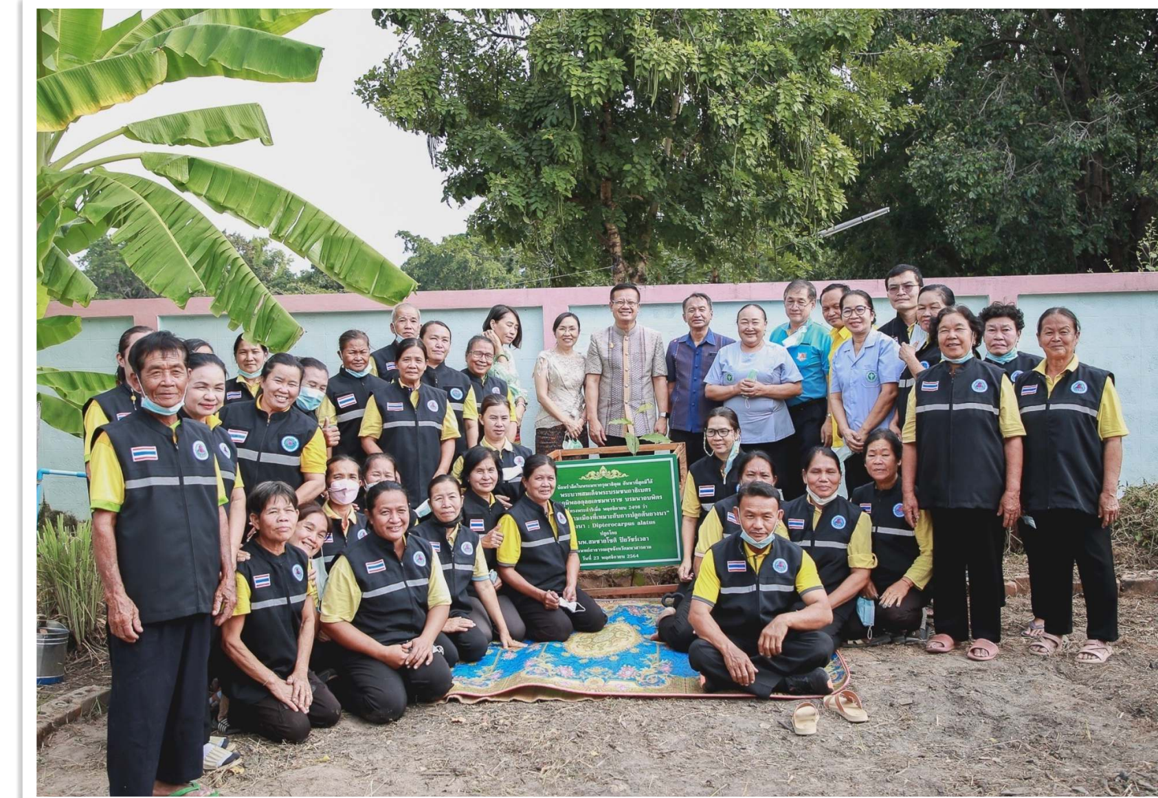
ต้นยางนา