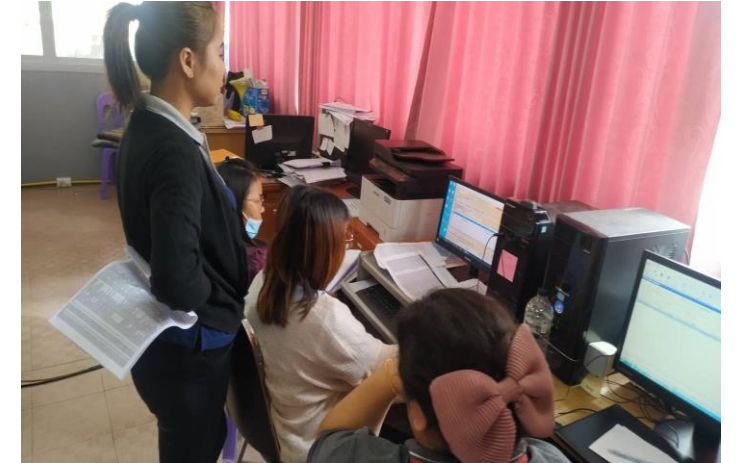
รายชื่อผู้ประสานงานโปรแกรม e-claim